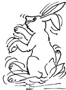
Ill.: Heidrun Schlieker